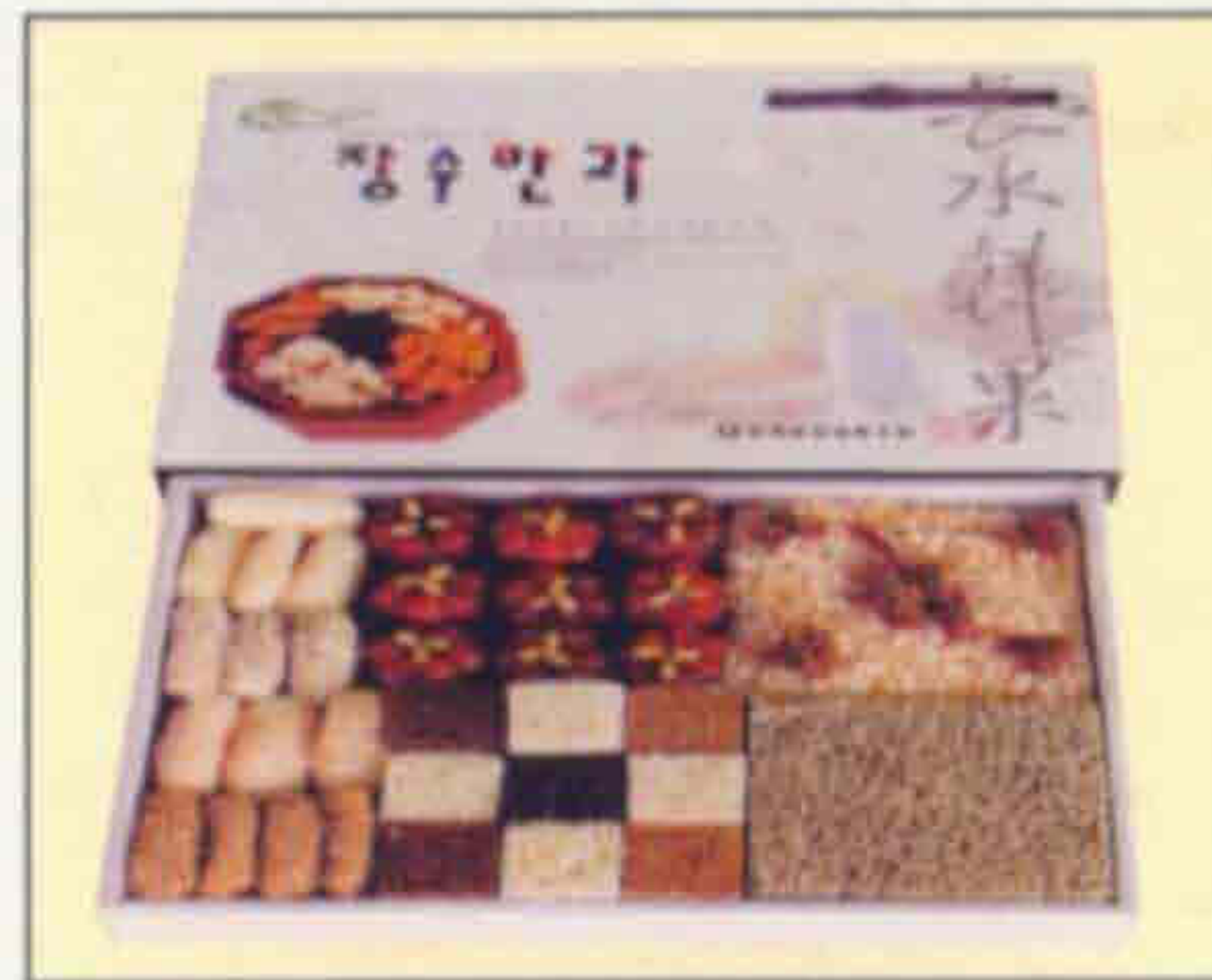
장수 전통 민과