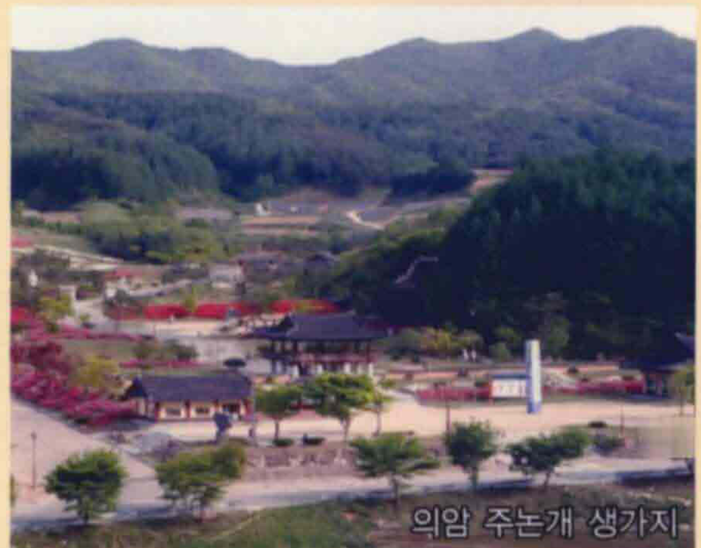
의암 주논개 생가지