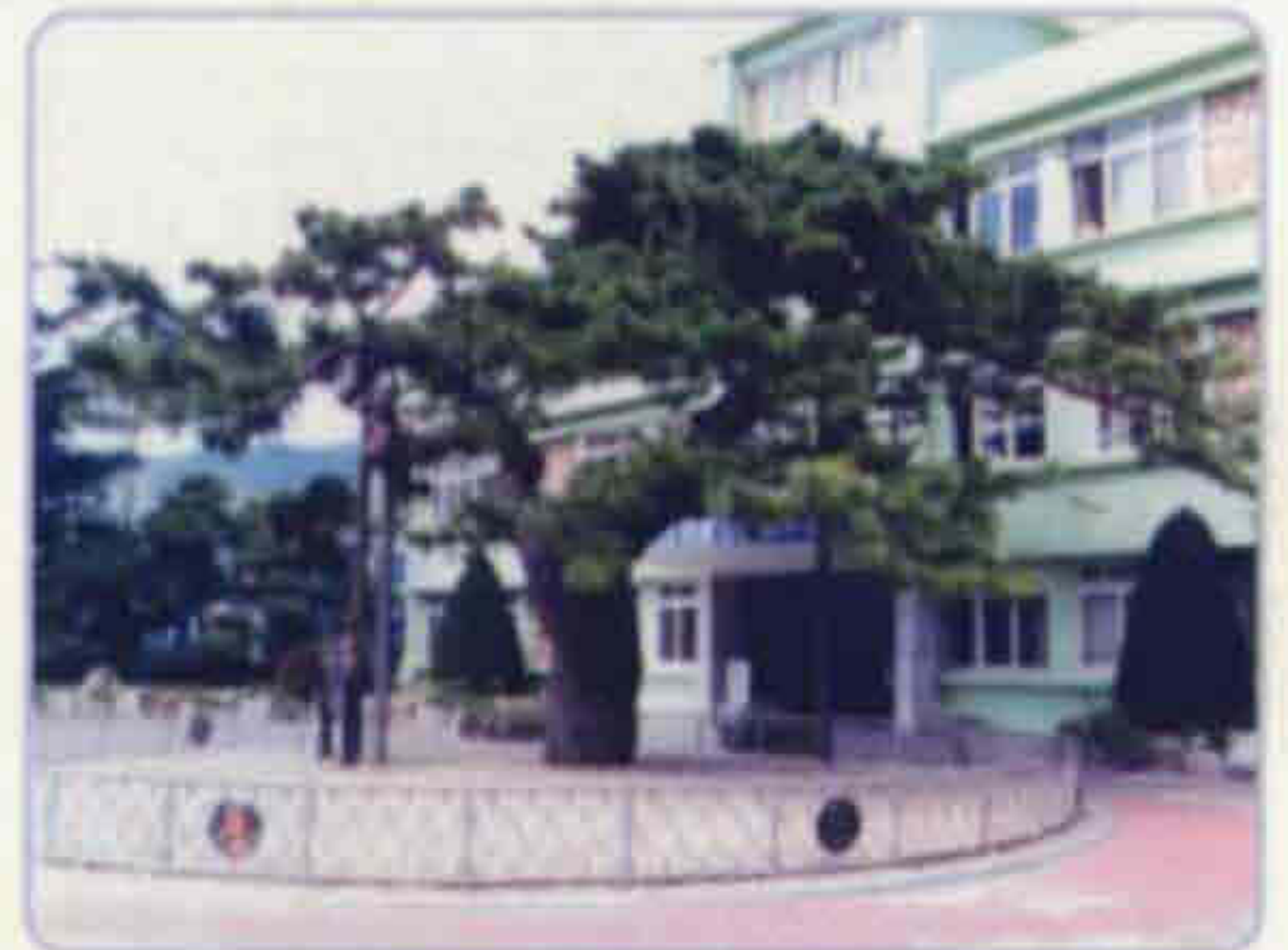
군의 나무 / 소나무