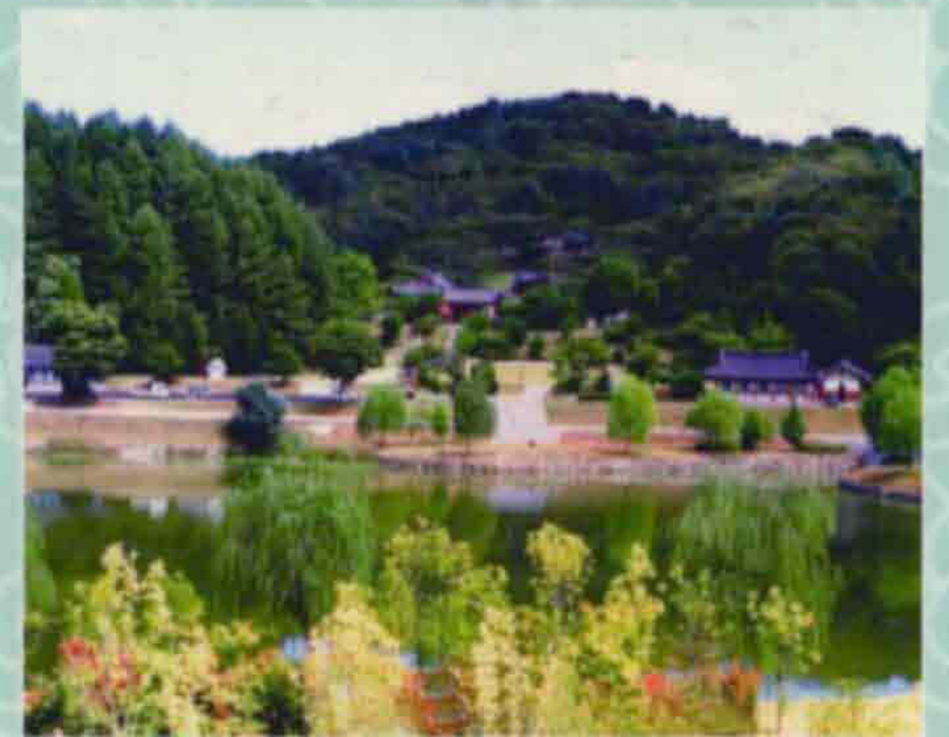
▲ 의암사(장수읍 두산리)