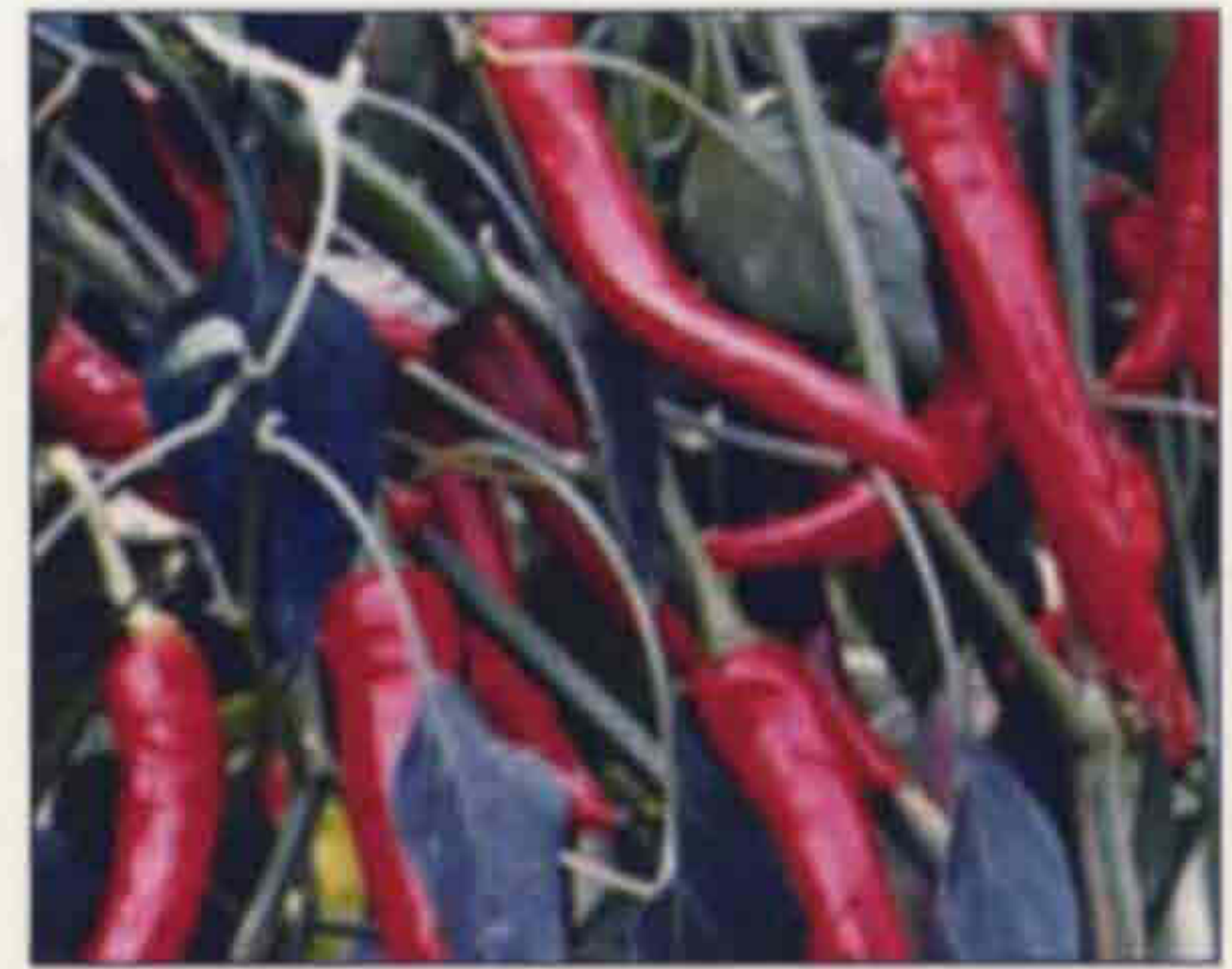
장수 태양초 고추