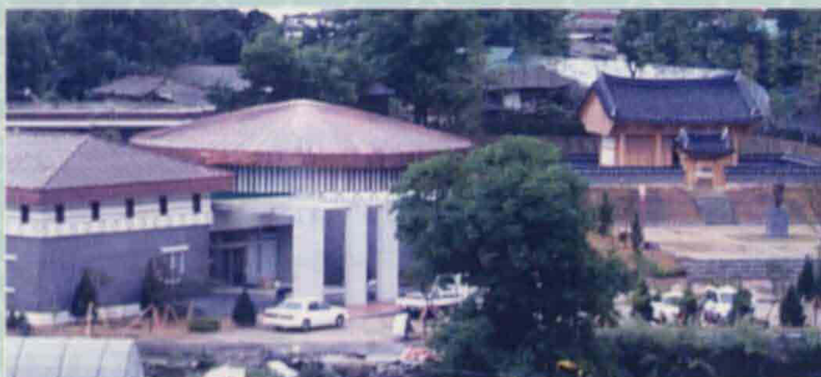
▲ 백용성 조사 생가지-죽림정사(번암면 죽림리)