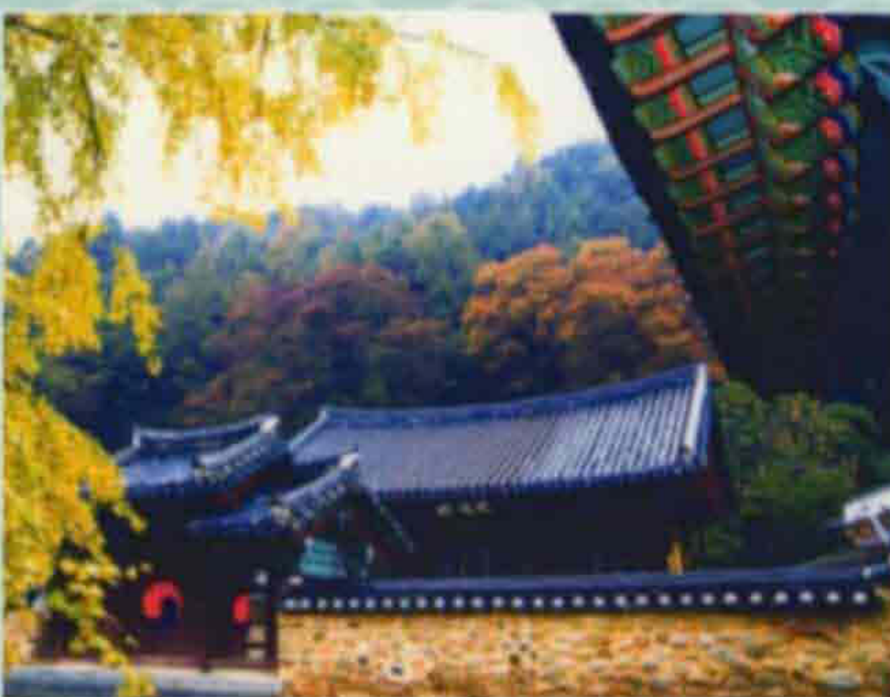
▲ 장수향교(장수읍 장수리)