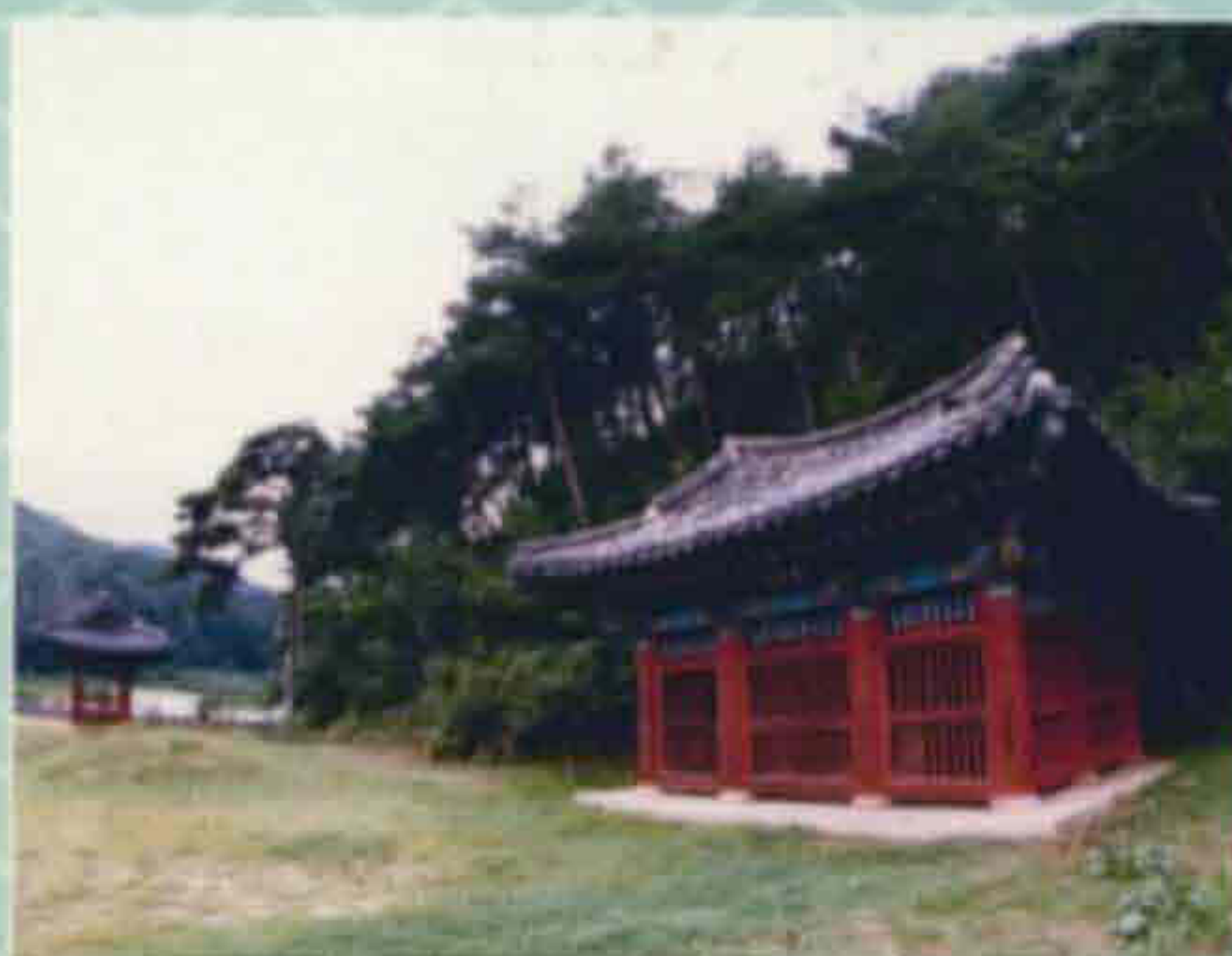
▲ 타루공원(천천면 장판리)