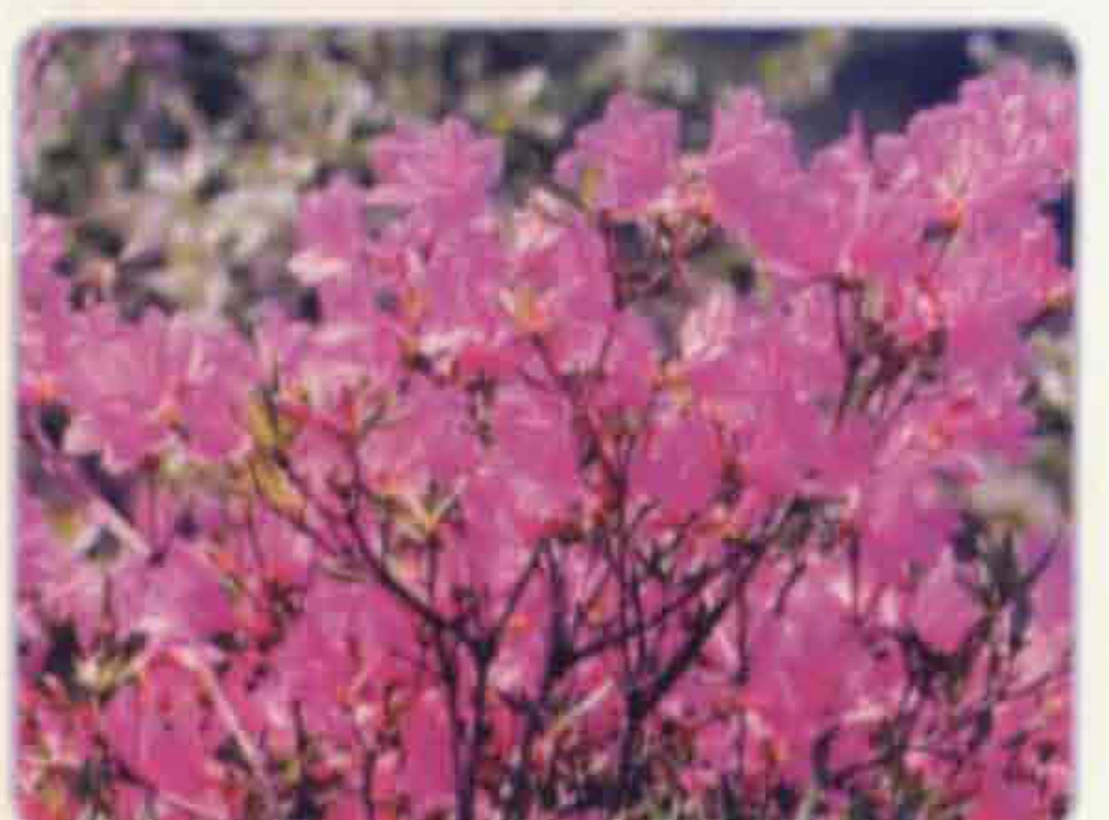
군의 꽃 / 산철쭉