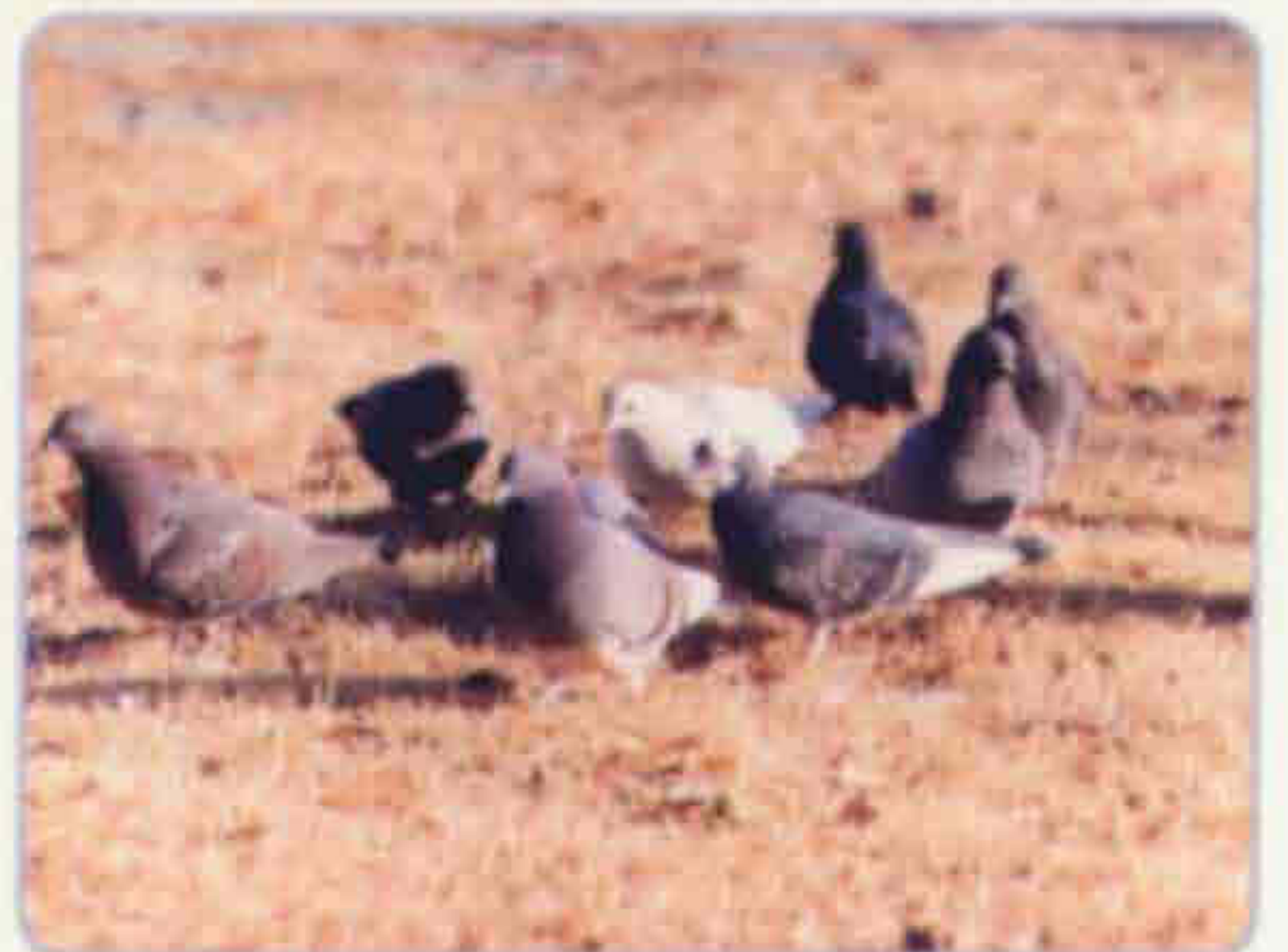
군의 새 / 비둘기