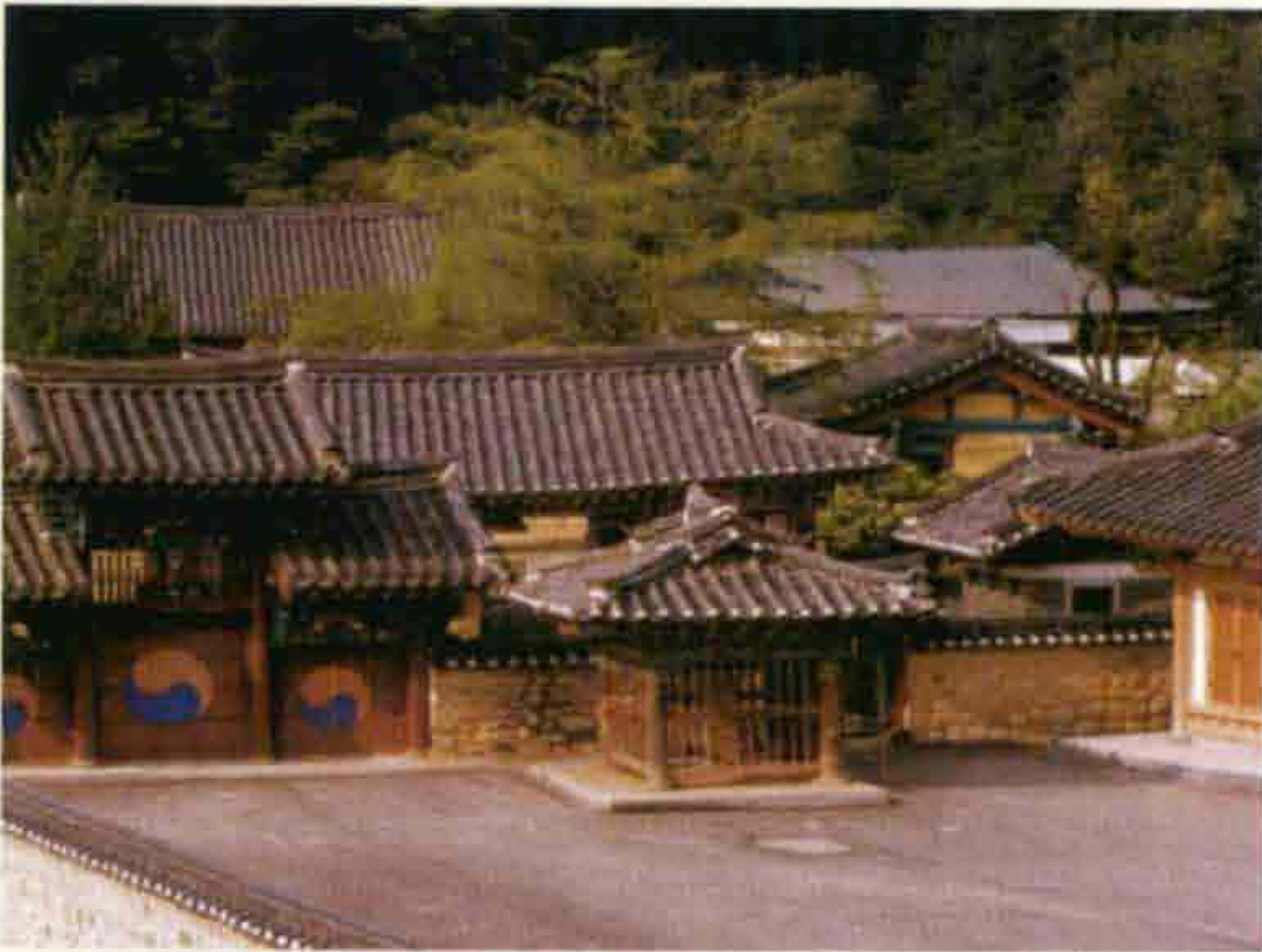
▲ 장수향교(장수읍 장수리)