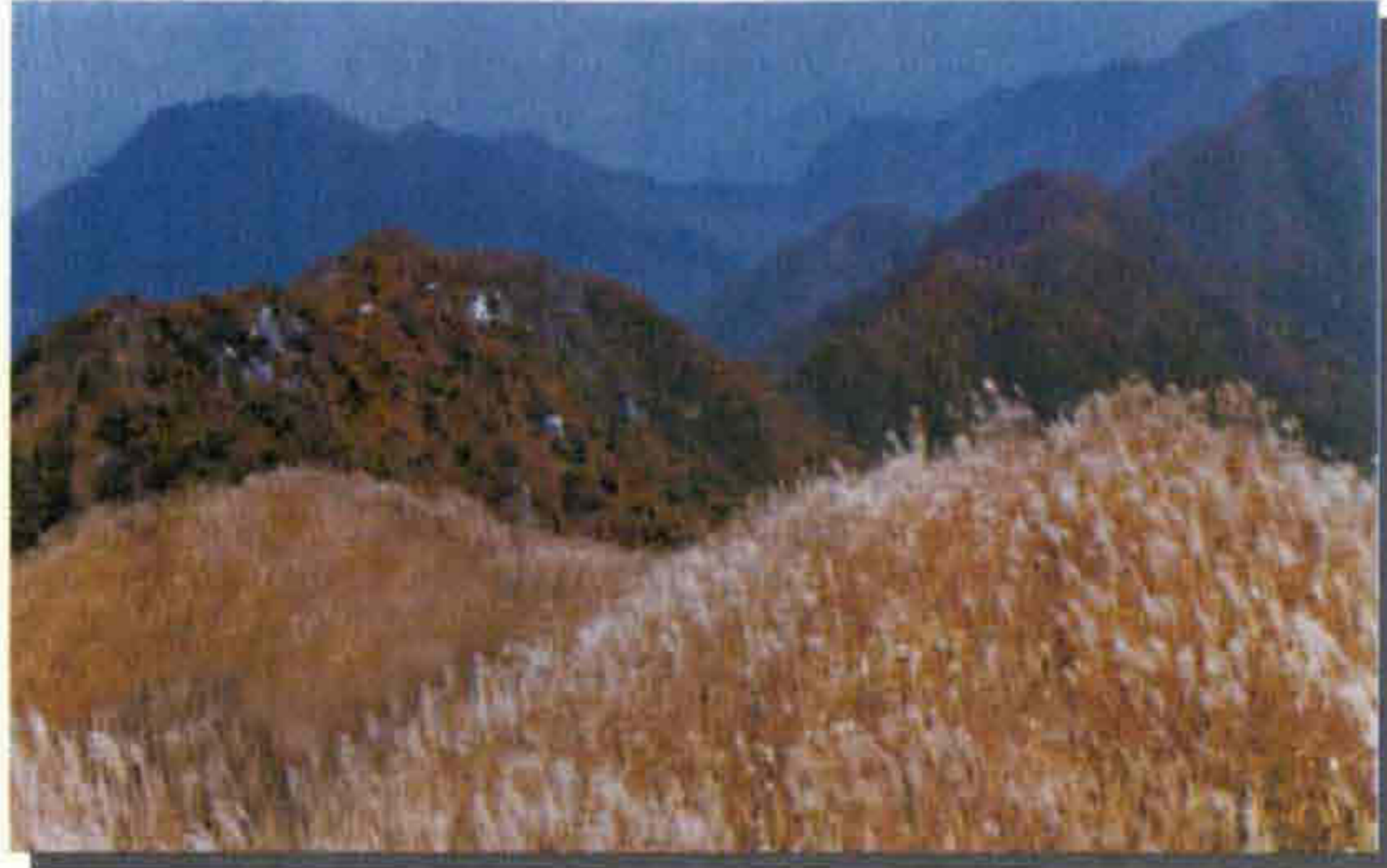
▲ 장안산 군립공원 조선 8대 종산이기도 한 장안산은 가을철 광활한 억새밭과 정상에서 바라본 겨울철 설경이 절경이다.