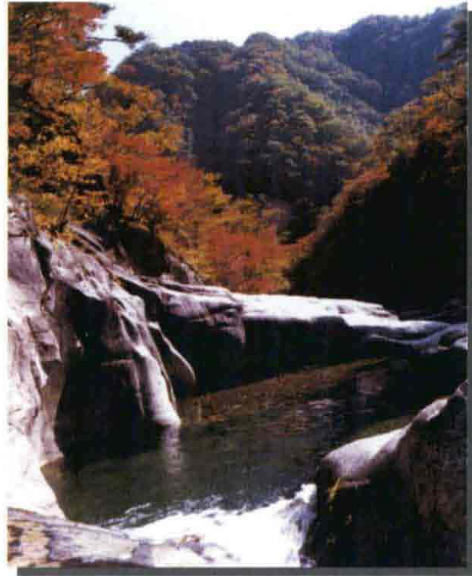
▲ 덕산용소 용이 살았다는 전설이 있으며 바위 사이로 흐르는 청류수는 은쟁반에 옥구슬 구르는 소리와 같다.