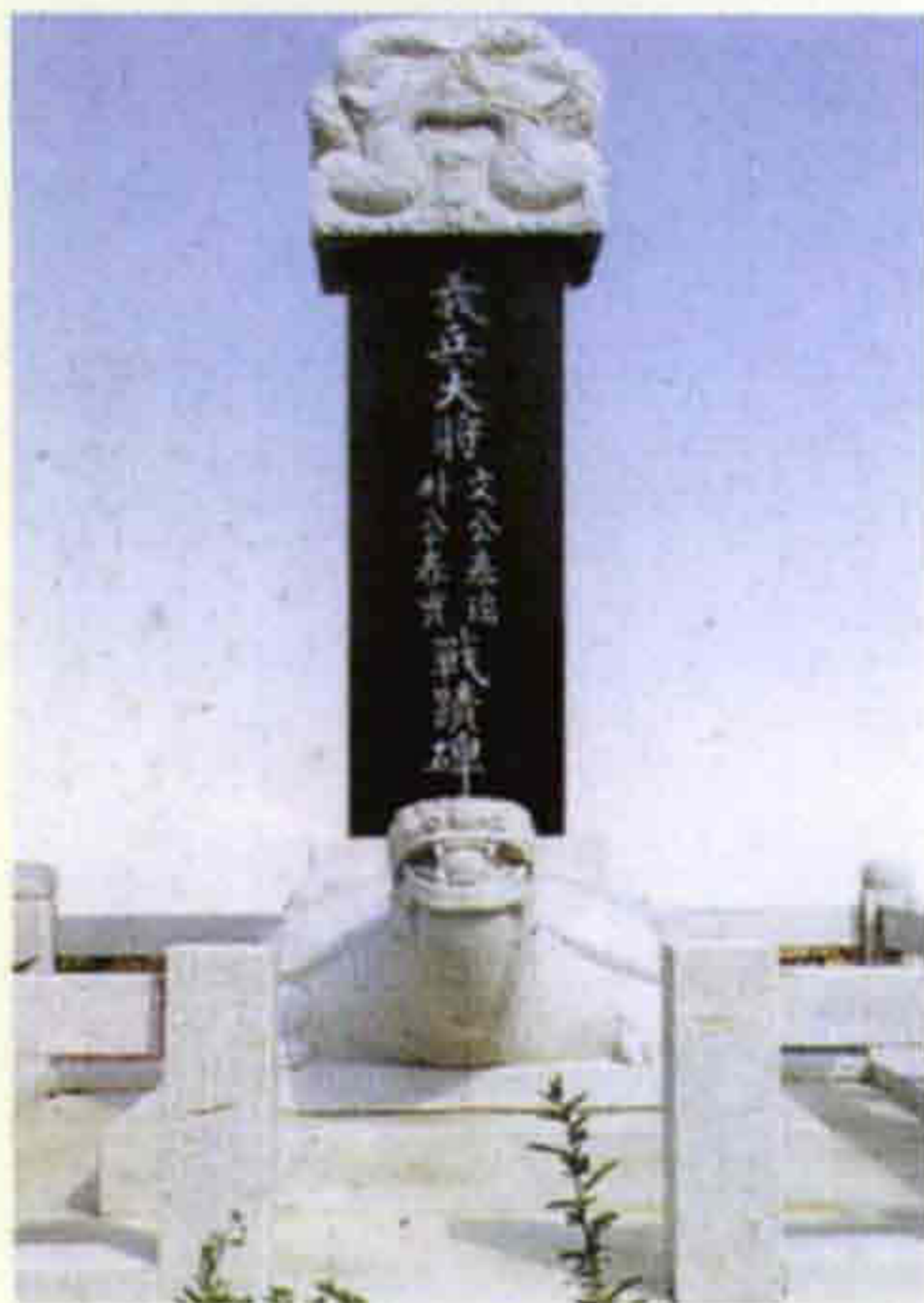
◀ 의병대장 문태서 · 박춘실 전적비 (계북면 양악리)