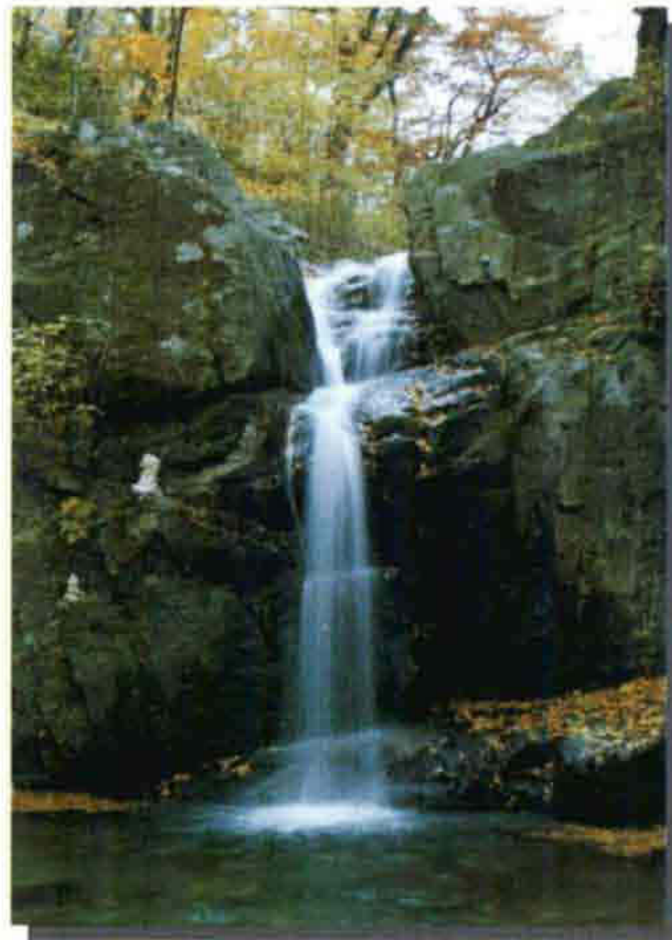
▲ 지지계곡 가을 단풍이 장관을 이루며, 산자수명하여 사계절 관광지로 각광받고있다.