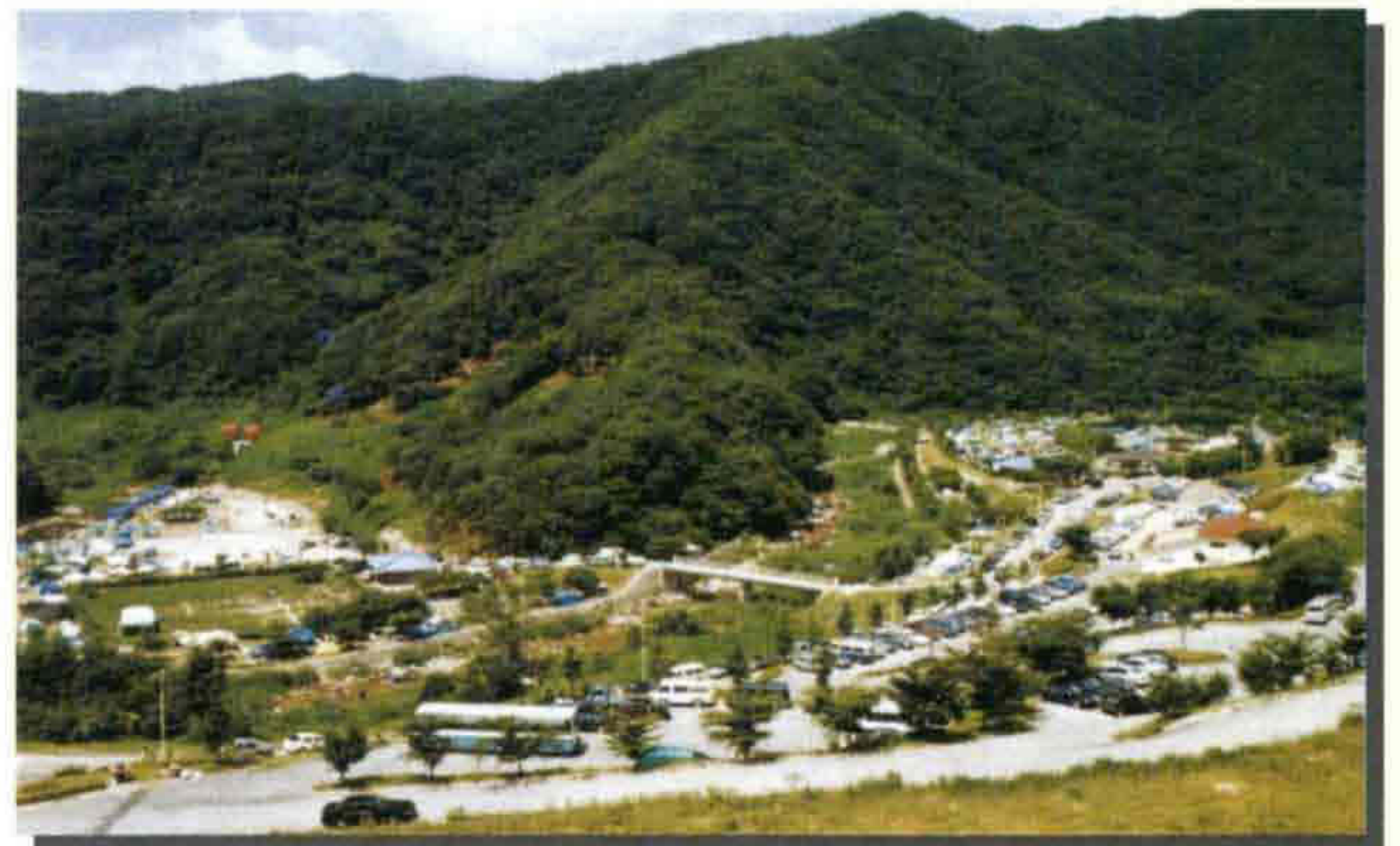
▲ 방화동 가족휴가촌 오토캠핑장 시설을 갖춘 심산유곡의 휴양지로서 여름철 가족단위 캠프장으로 최적지이다.