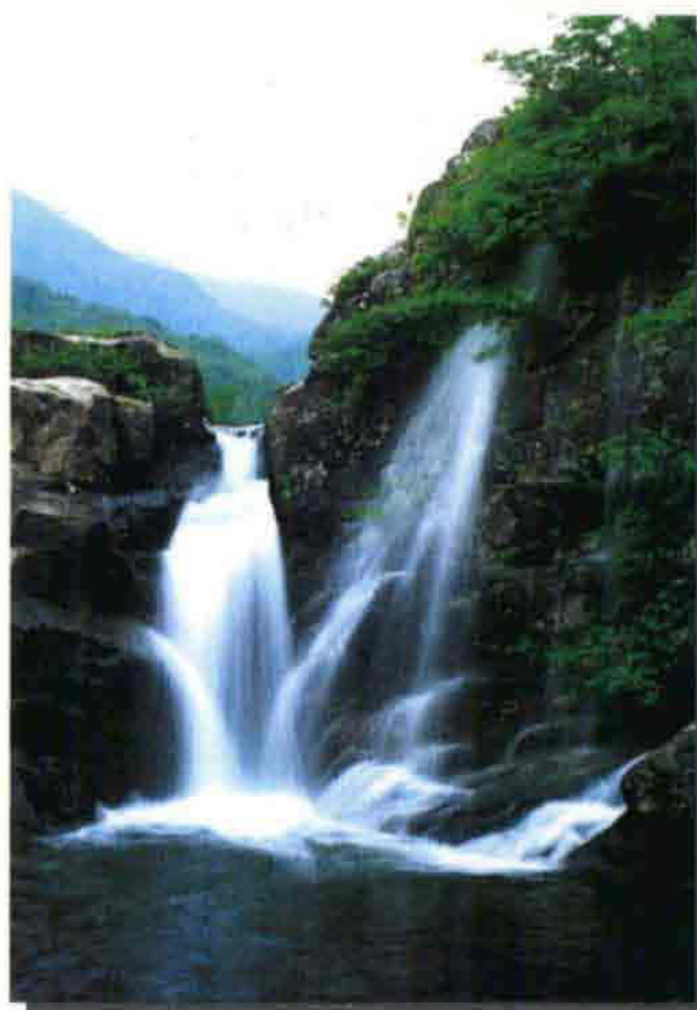
◀ 토옥동 계곡 남덕유산의 여러 골짜기중 가장 웅장하고 수려한 계곡이다.