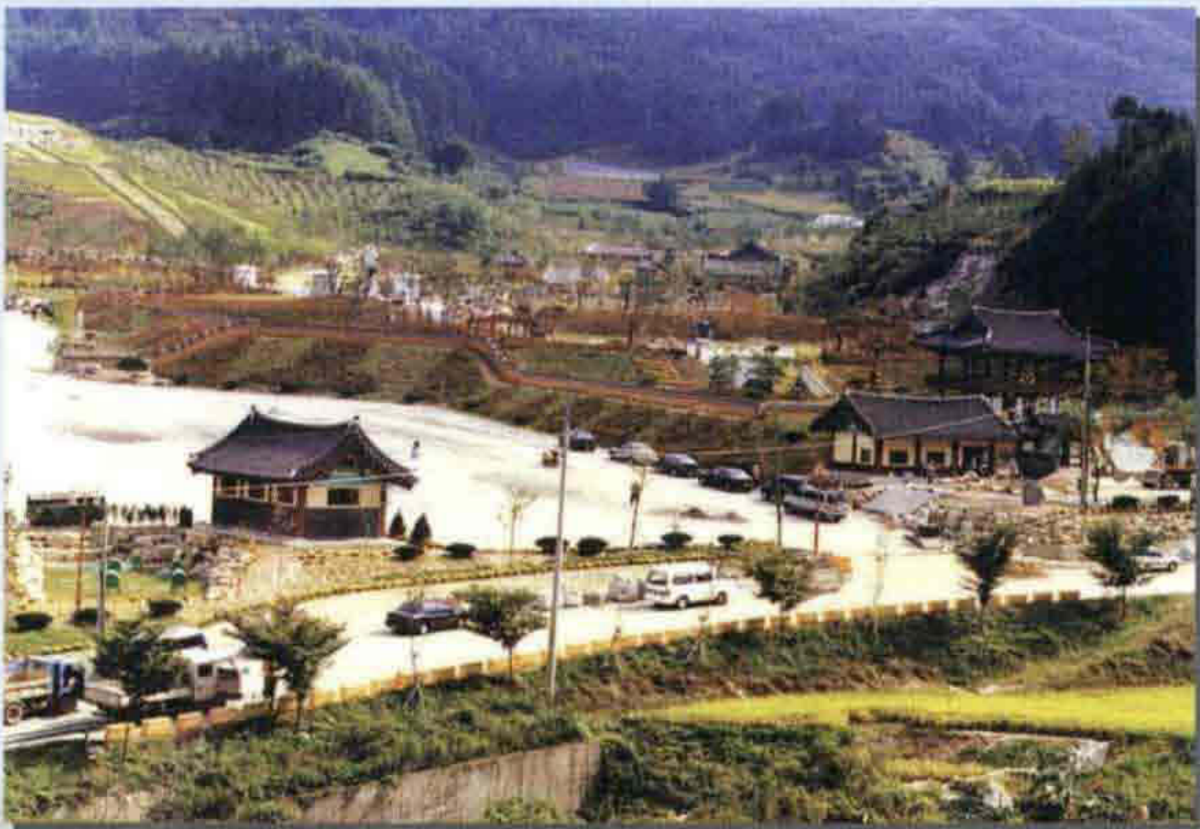
▲ 의암 주논개 생가지