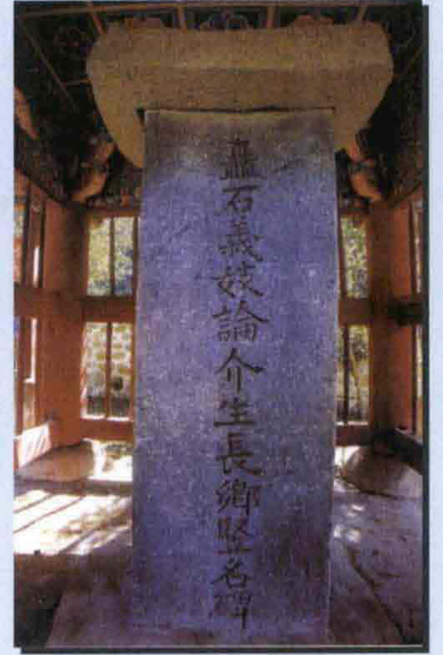
▲ 논개 성장향수명비