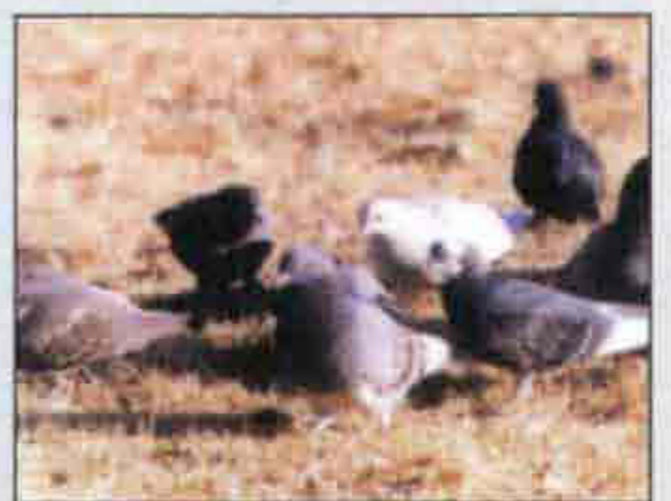
군의 새 / 비둘기