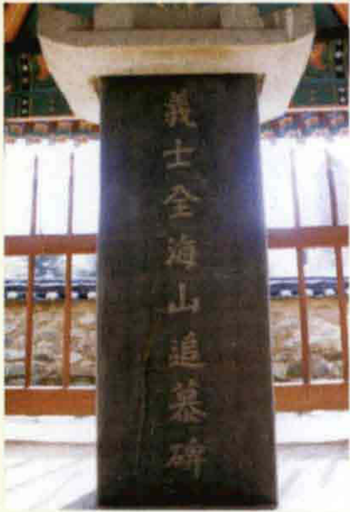
◀ 의사 전해산 추모비 (번암면 노단리)