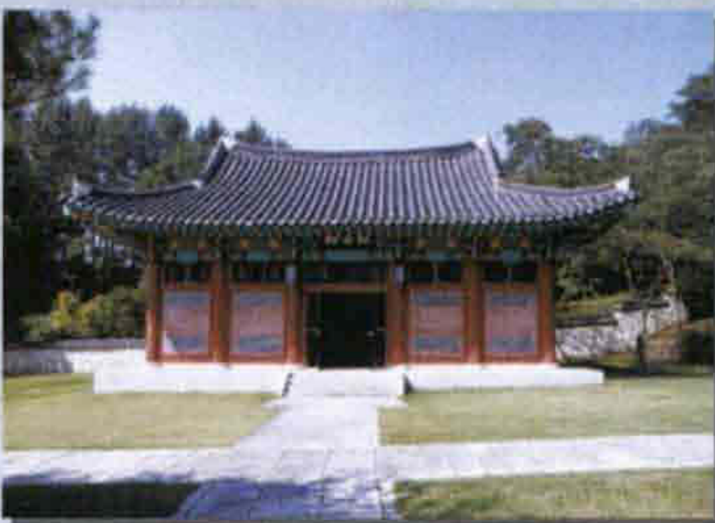
▲ 의암사 기념관