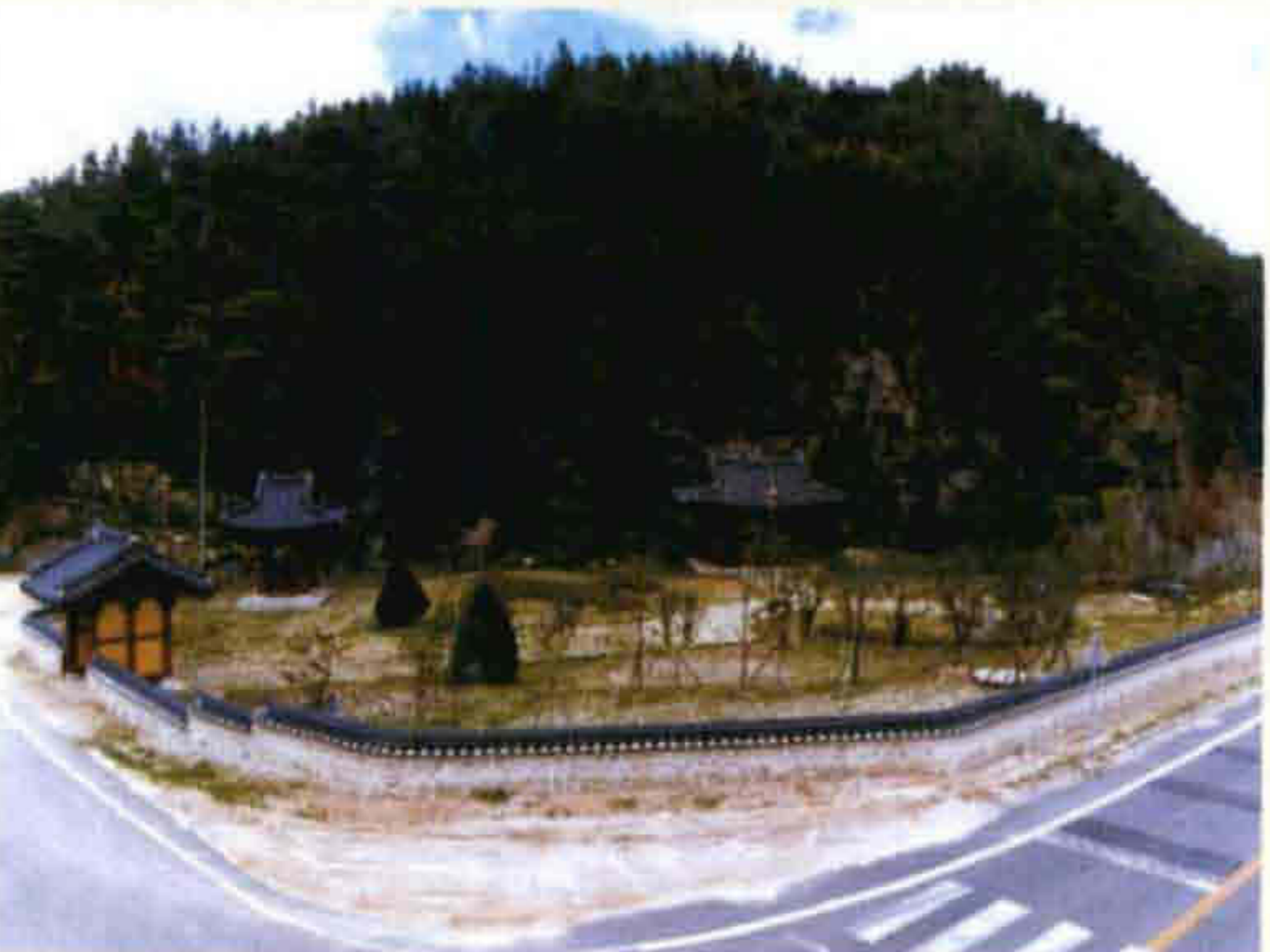
▲ 타루공원(천천면 장판리)