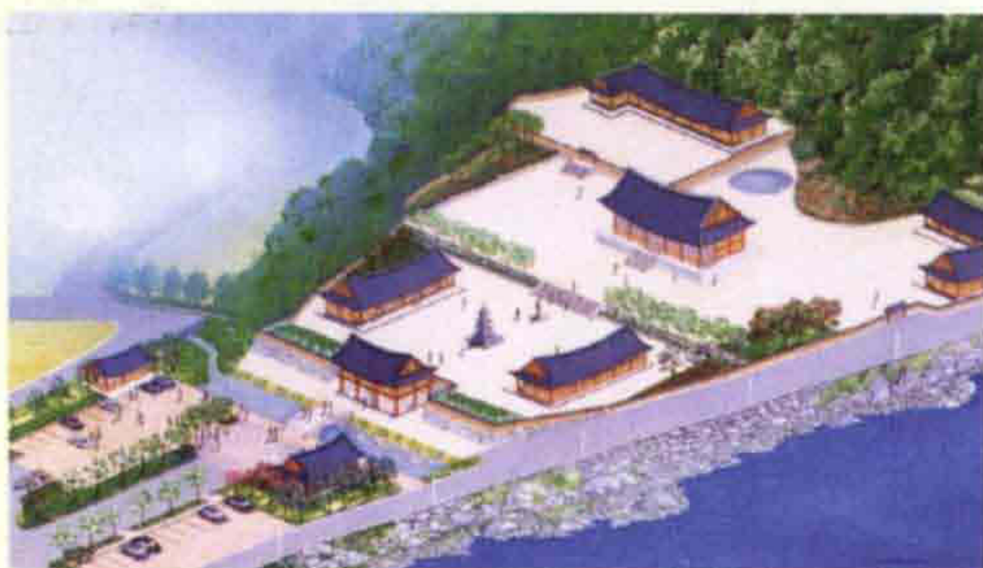
▲ 백용성 조사 생가지-죽림정사(번암면 죽림리)