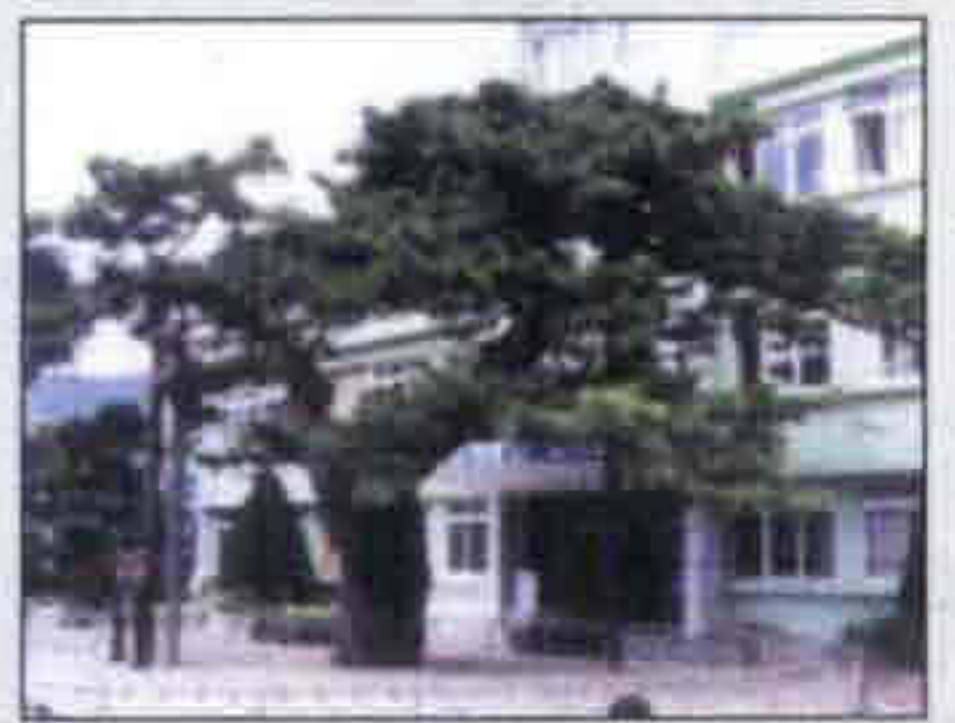
군의 나무 / 소나무