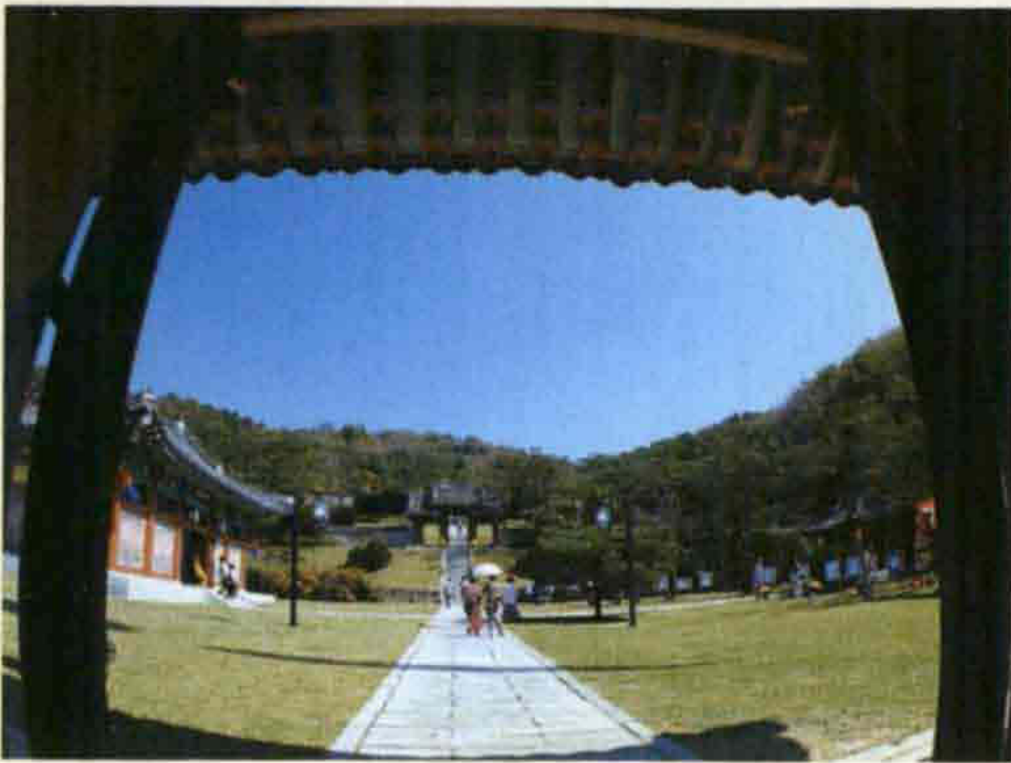
▲ 의암사(장수읍 두산리)