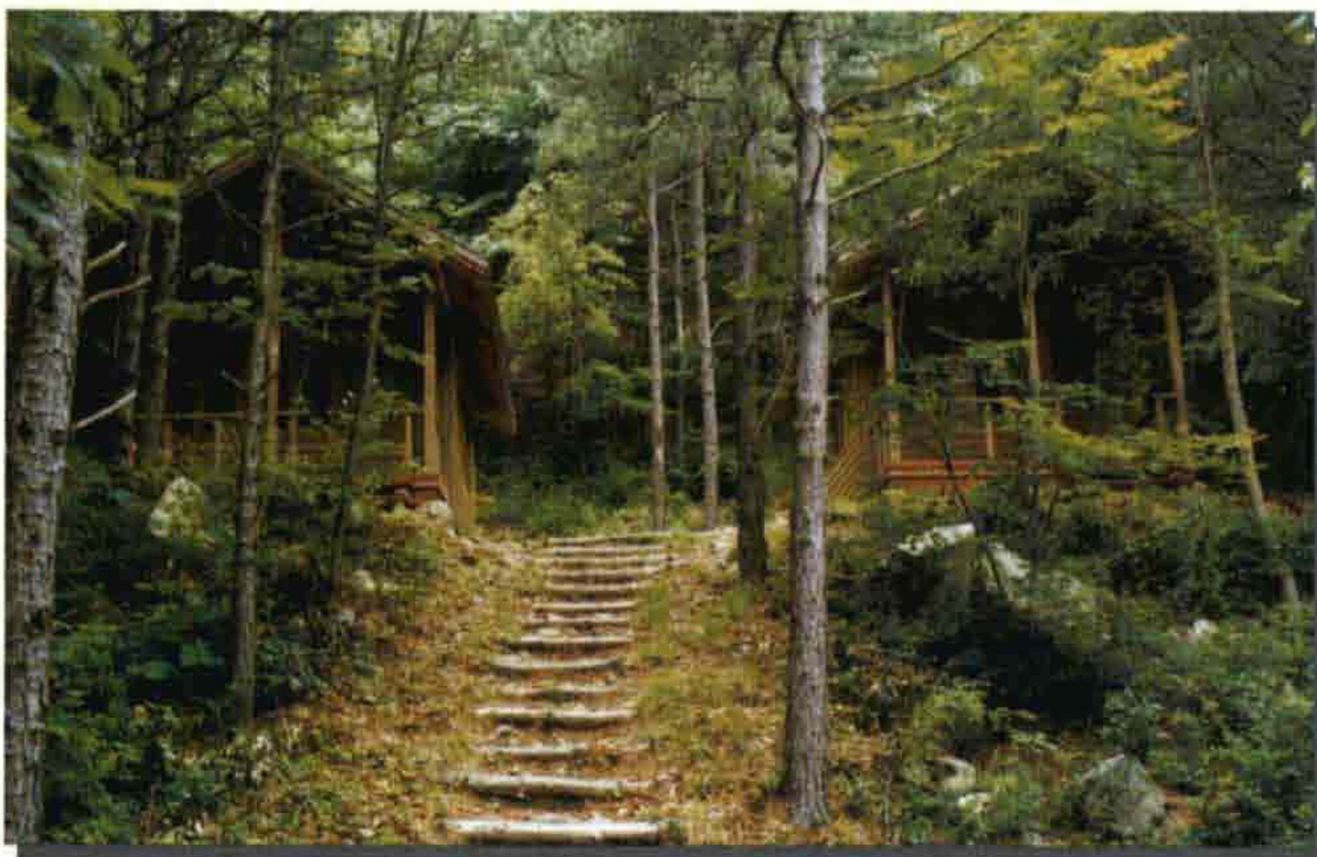
▲ 와룡자연휴양림 와룡계곡의 자연림내에 연수의 집, 산막, 물·눈썰매장, 물놀이장, 잔디광장 등 각종 휴양 편의시설이 완비되어 있어 도심의 피로를 풀고 심신을 단련하기에 최적지이다.