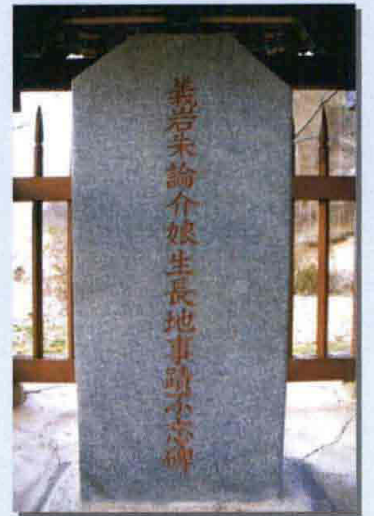
▲ 생가지 사적불망비