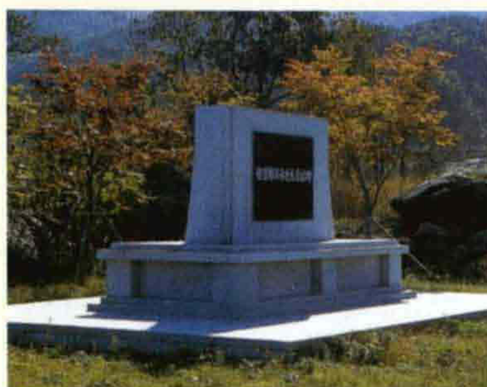
◀ 정인승 선생 유허비 (계북면 양악리)