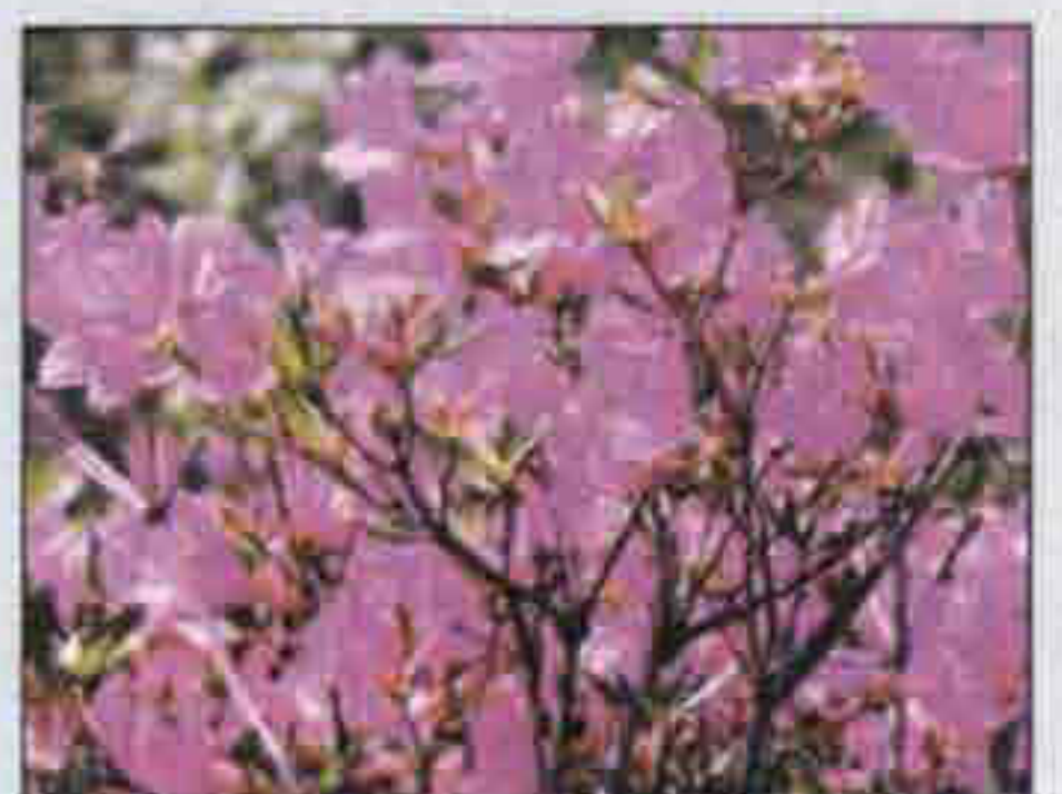
군의 꽃 / 산철쭉