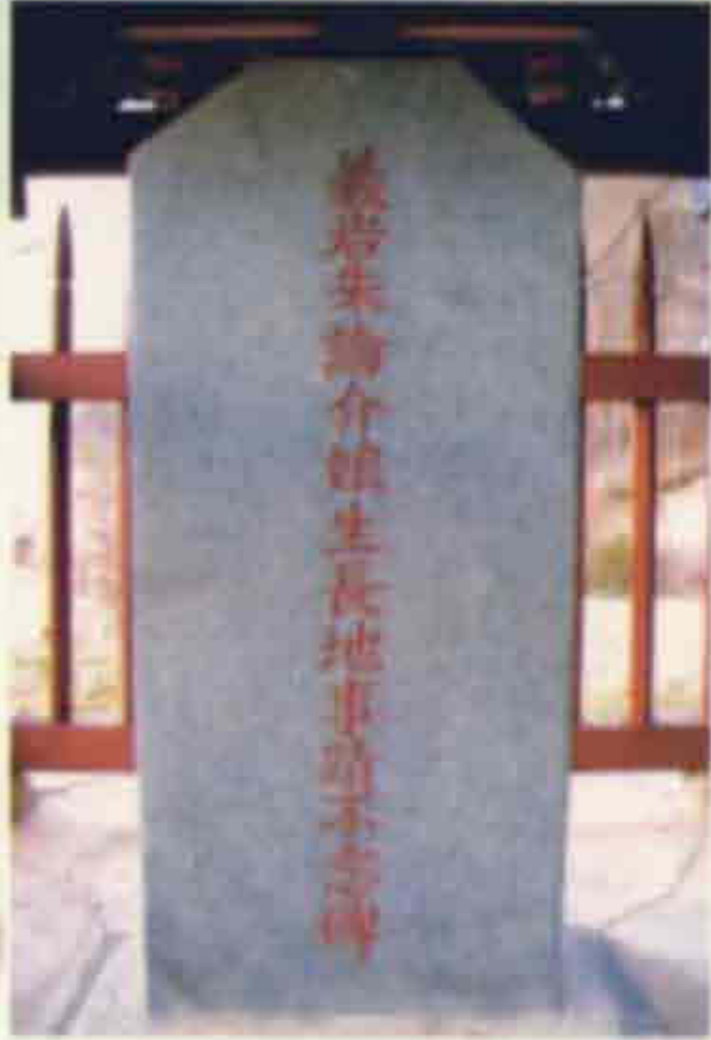
◀ 생가지 사적불망비