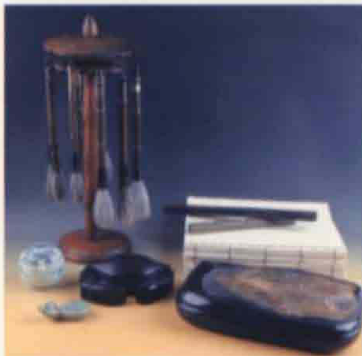
▲ 버 루