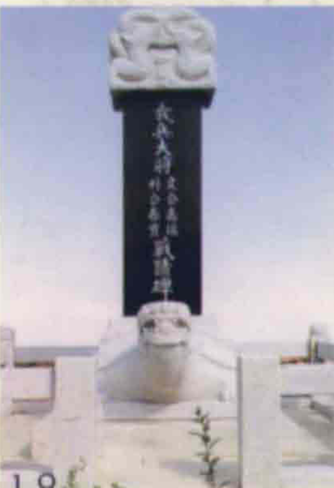
◀ 의병대장 문태서, 박춘실 전적비 (계북면 양악리)