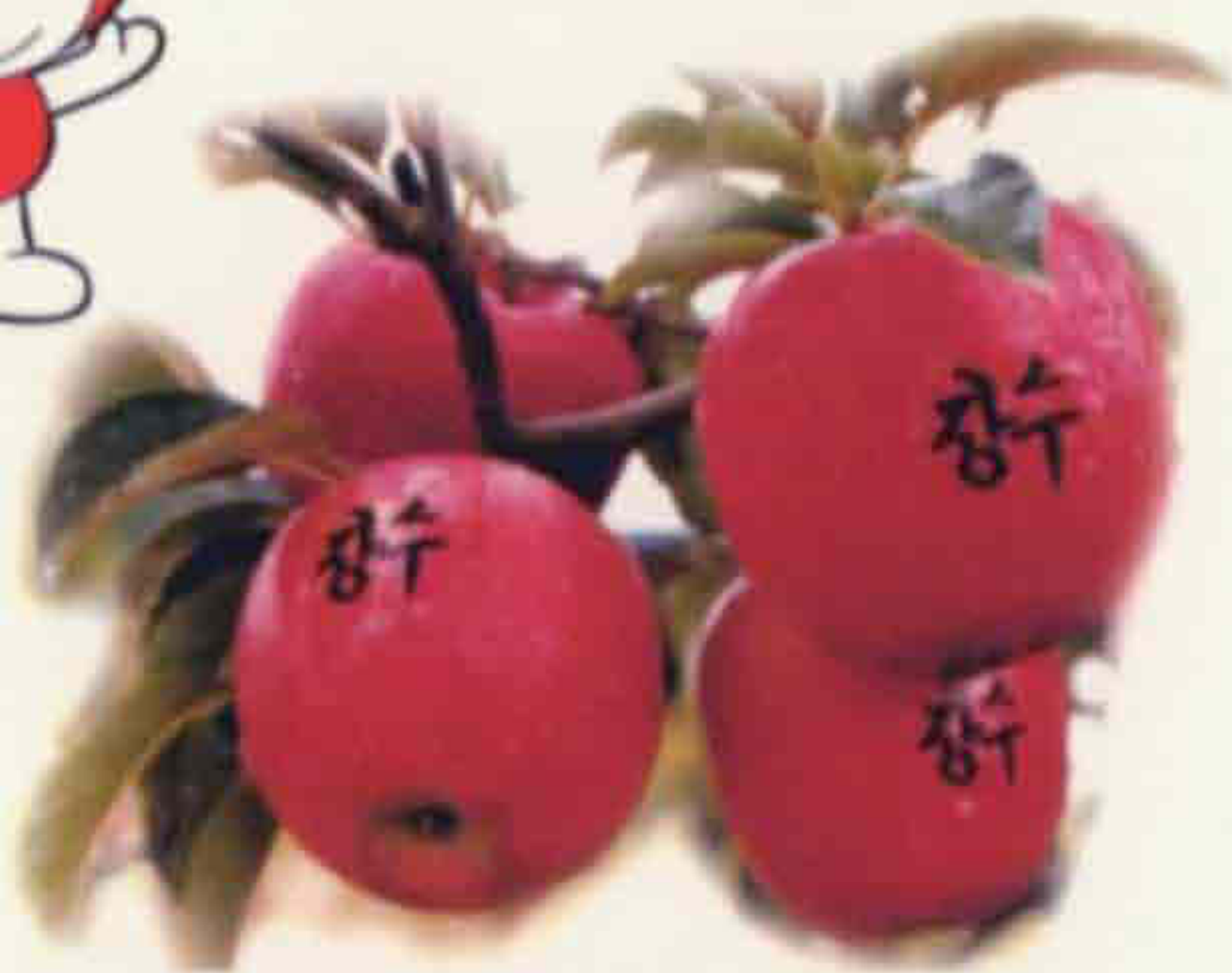
▲ 사 과

장수는 산간 고랭지대로 주야 일교차가 커 사과재배 적지로서 당도가 높고 맛과 향이 독특한 사과를 생산, 전국제일의 사과로 각광을 받고 있다.