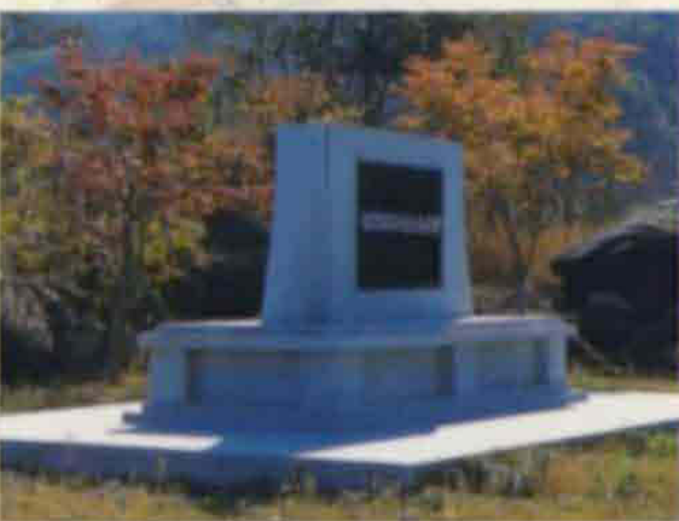
◀ 정인승 선생 유허비 (계북면 양악리)