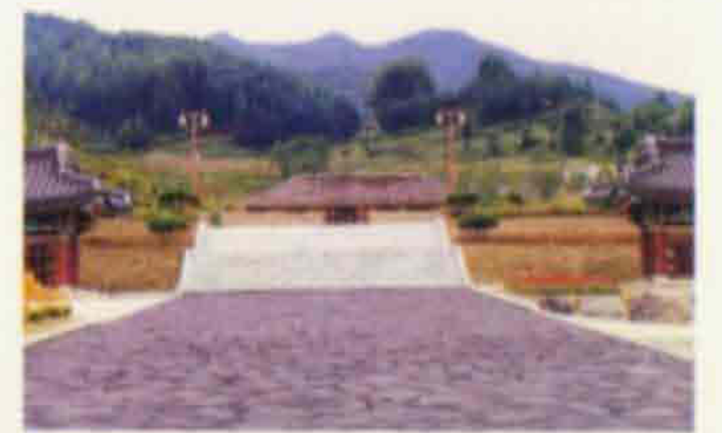
▲ 최경희장군추모비 의암주논개사적불망비