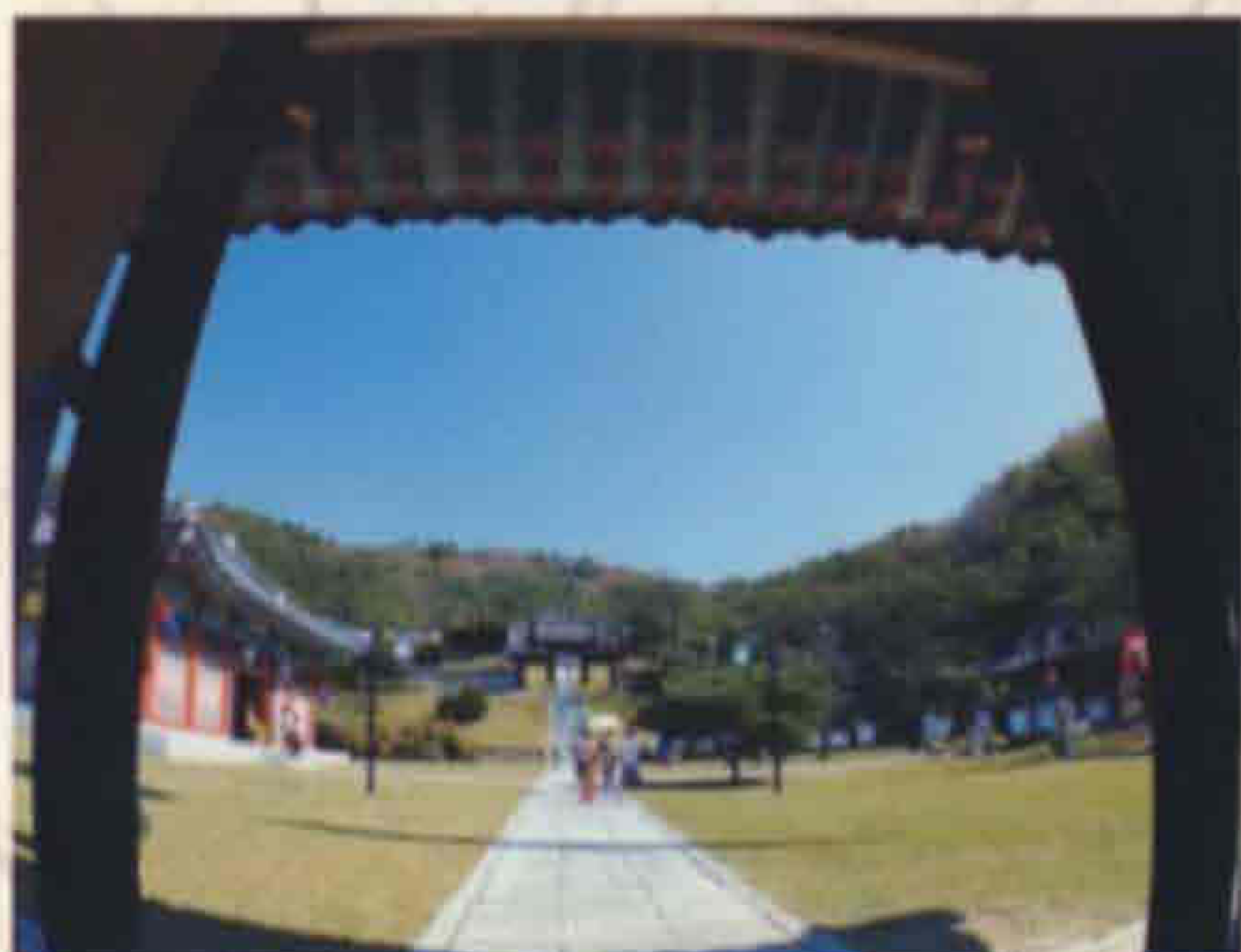
▲ 의암사(장수읍 두산리)