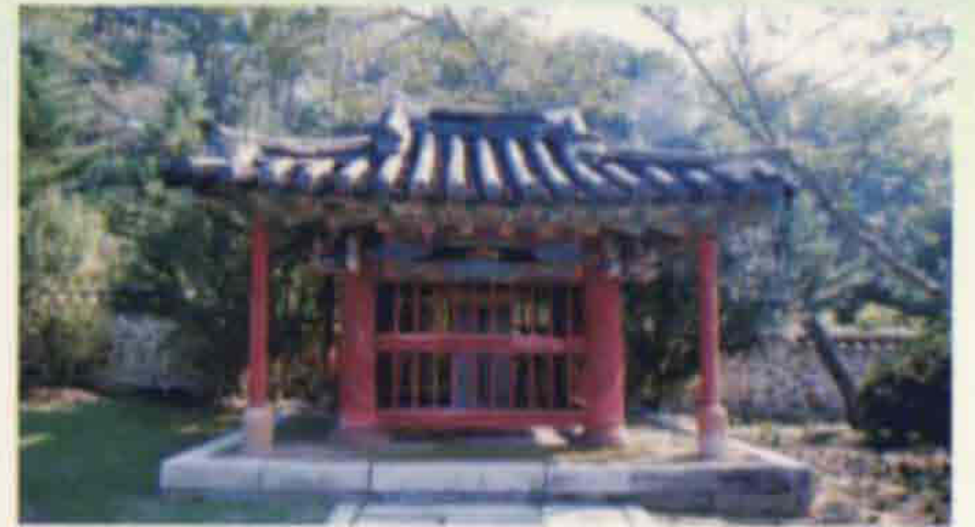
▲ 논개 성장향수명비