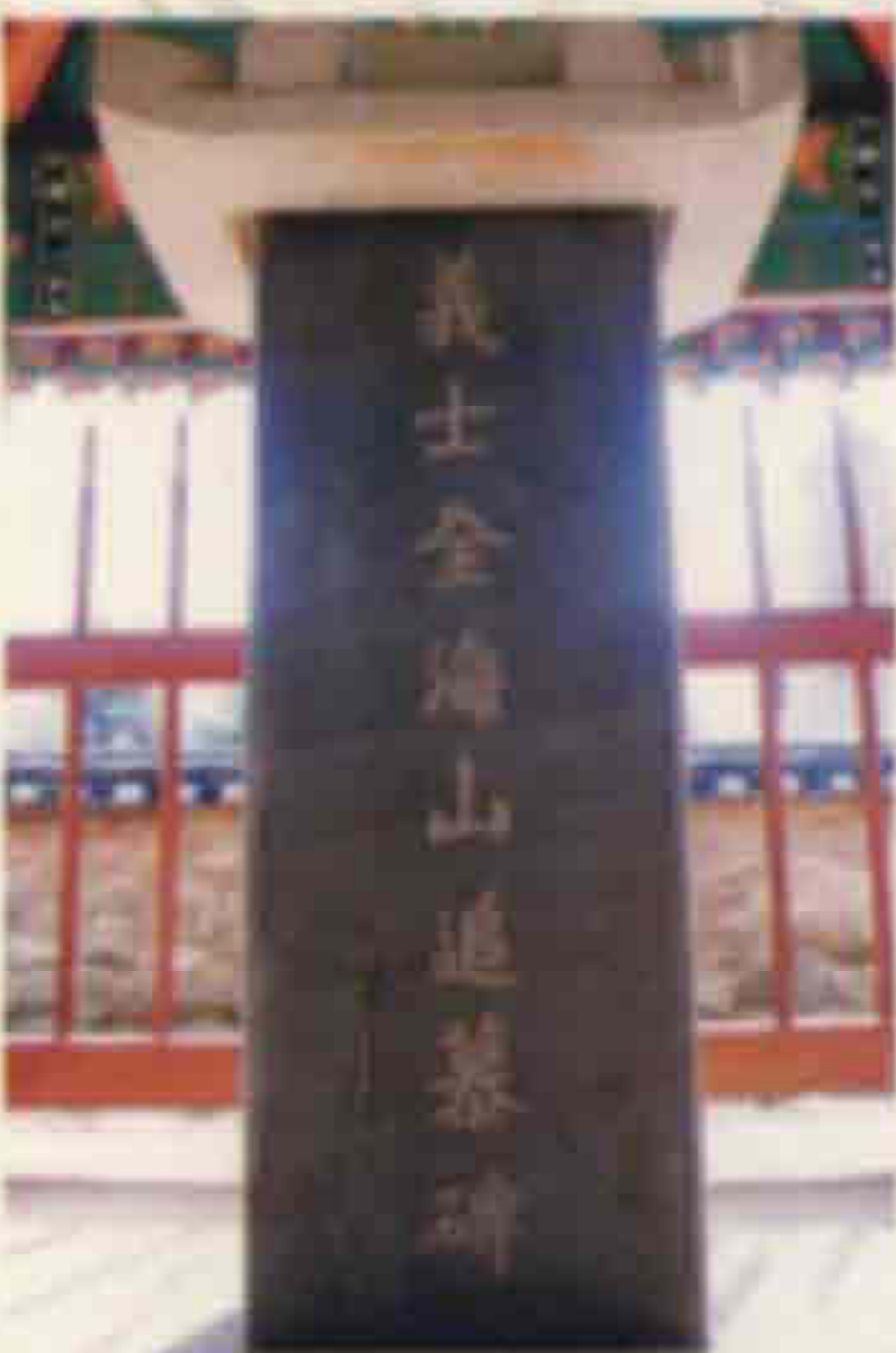
◀ 의사 전해산 추모비 (번암면 노단리)