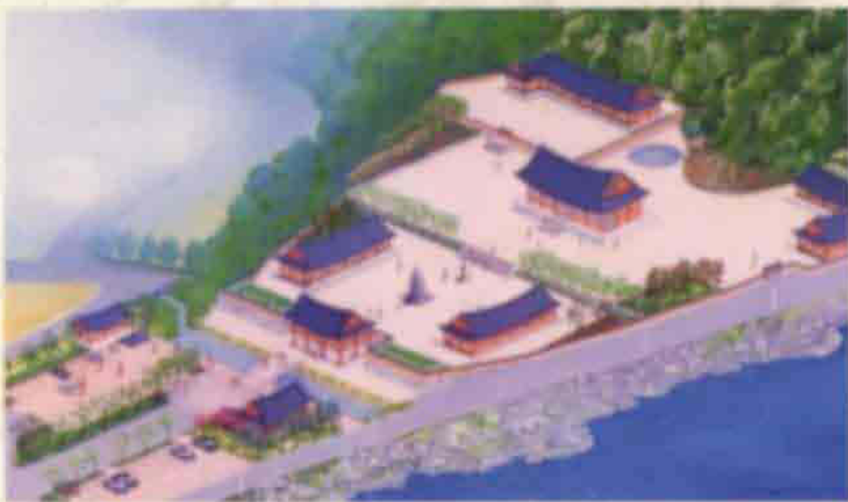
▲ 백용성 조사 생가지-죽림정사(번암면 죽림리)