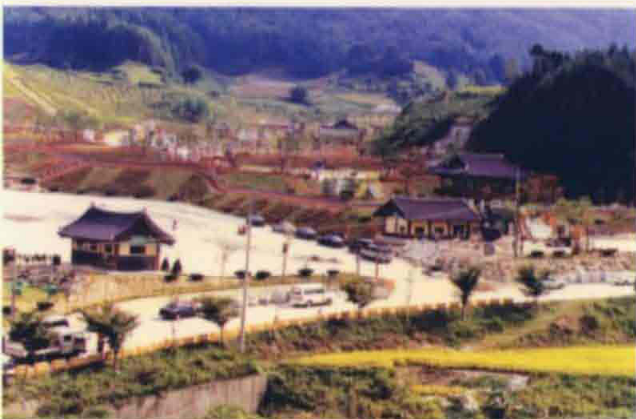
▲ 의암 주논개 생가지