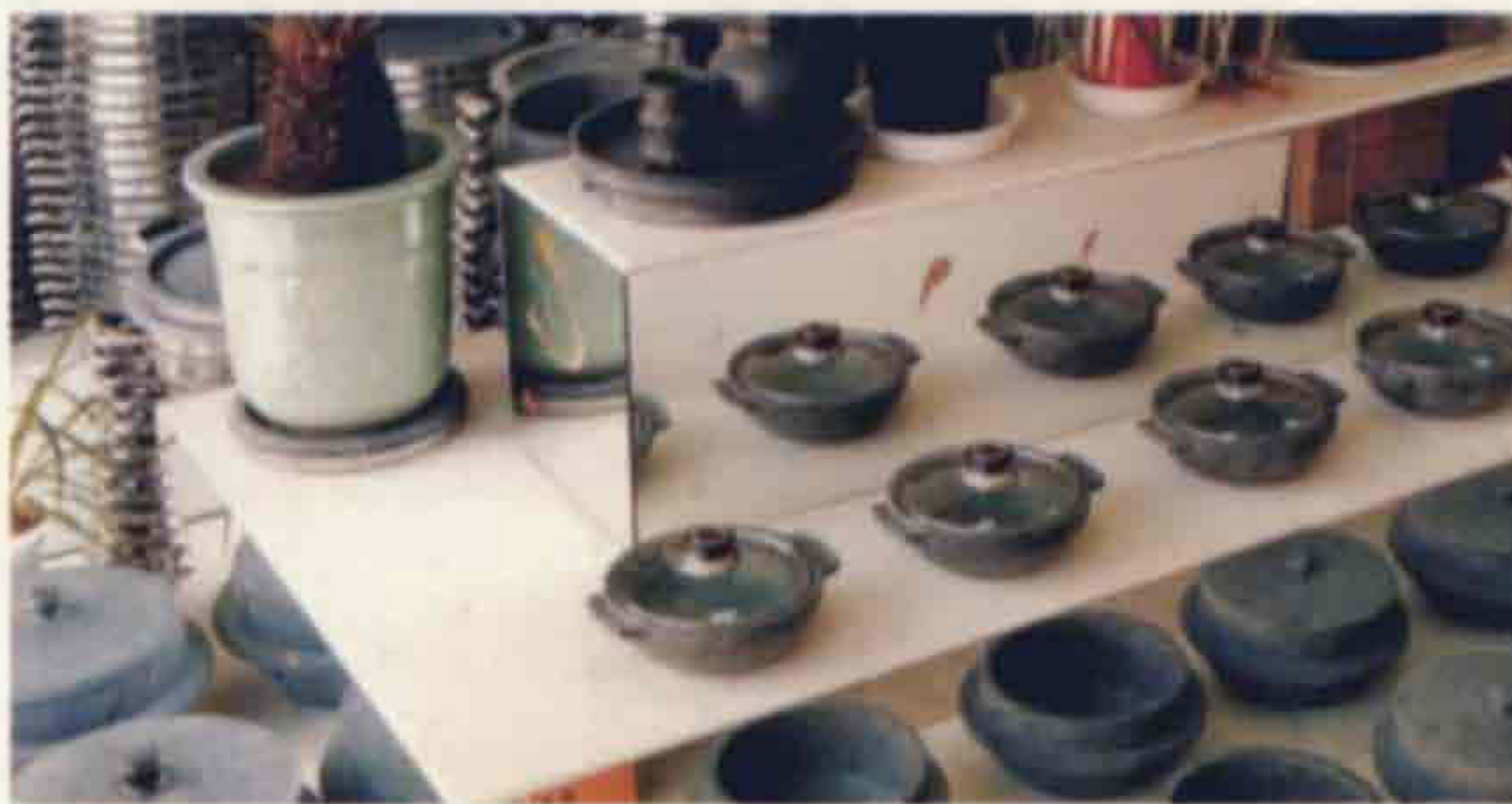
▲ 석 기