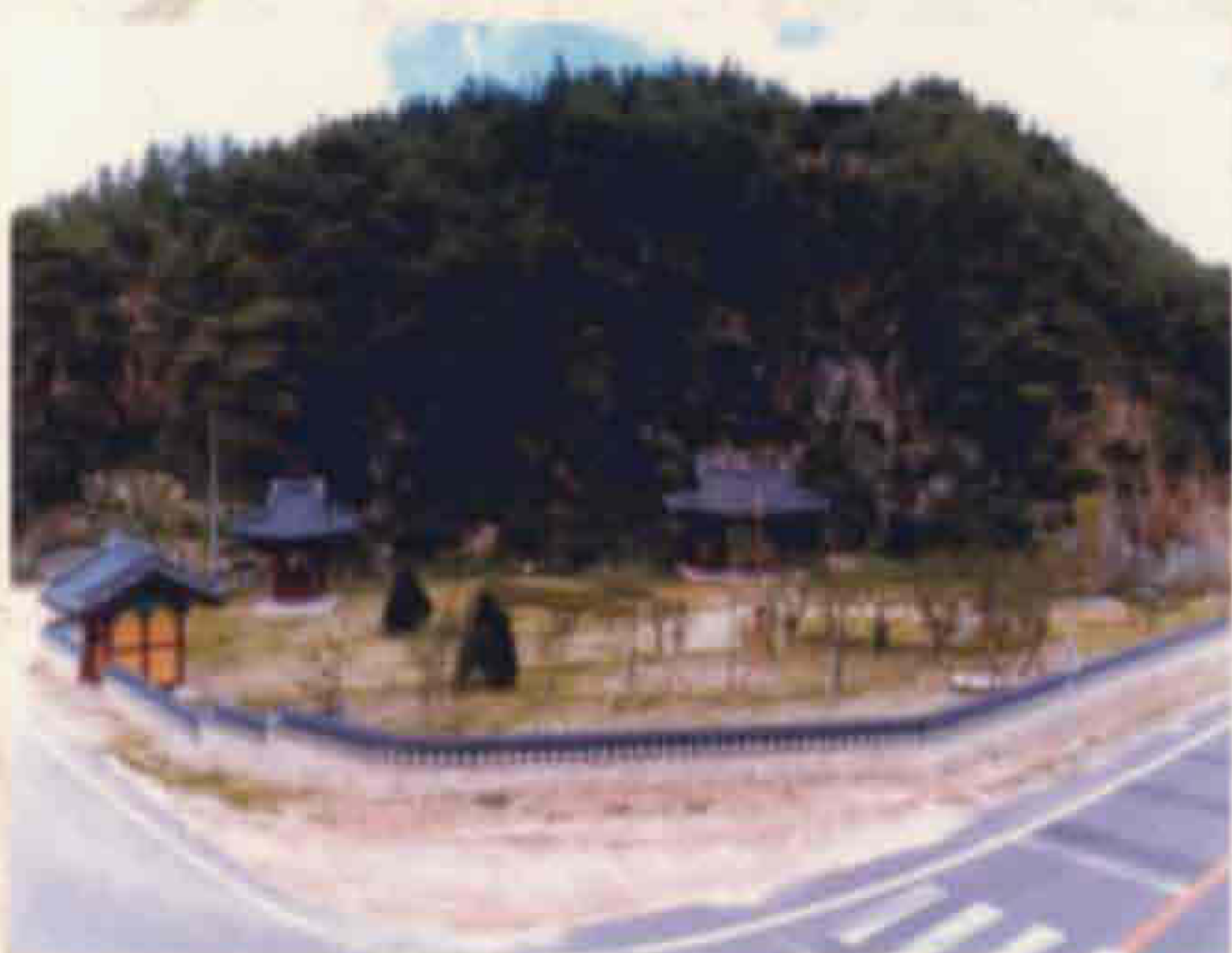
▲ 타루공원(천천면 장판리)