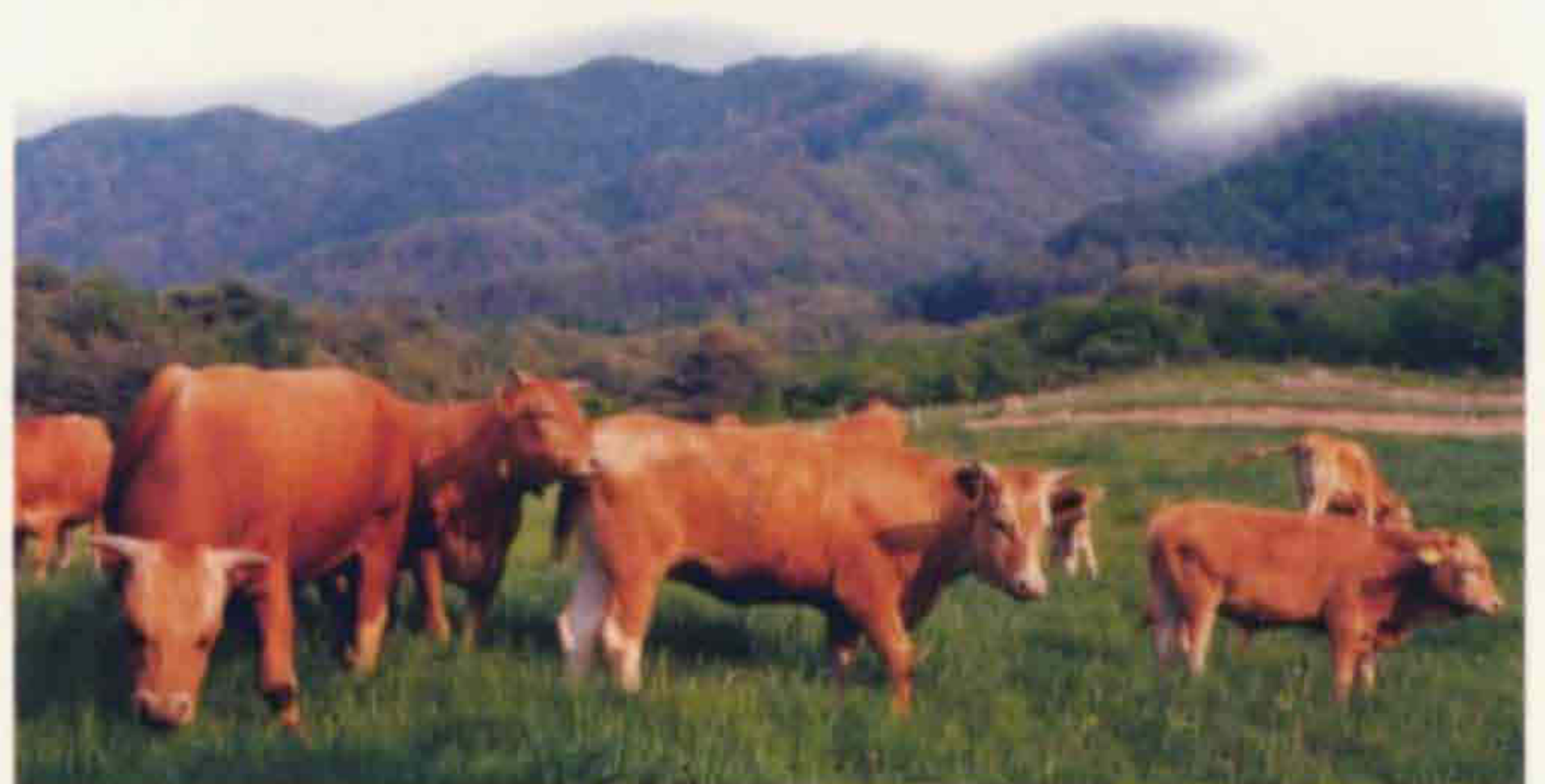
한 우 ▶