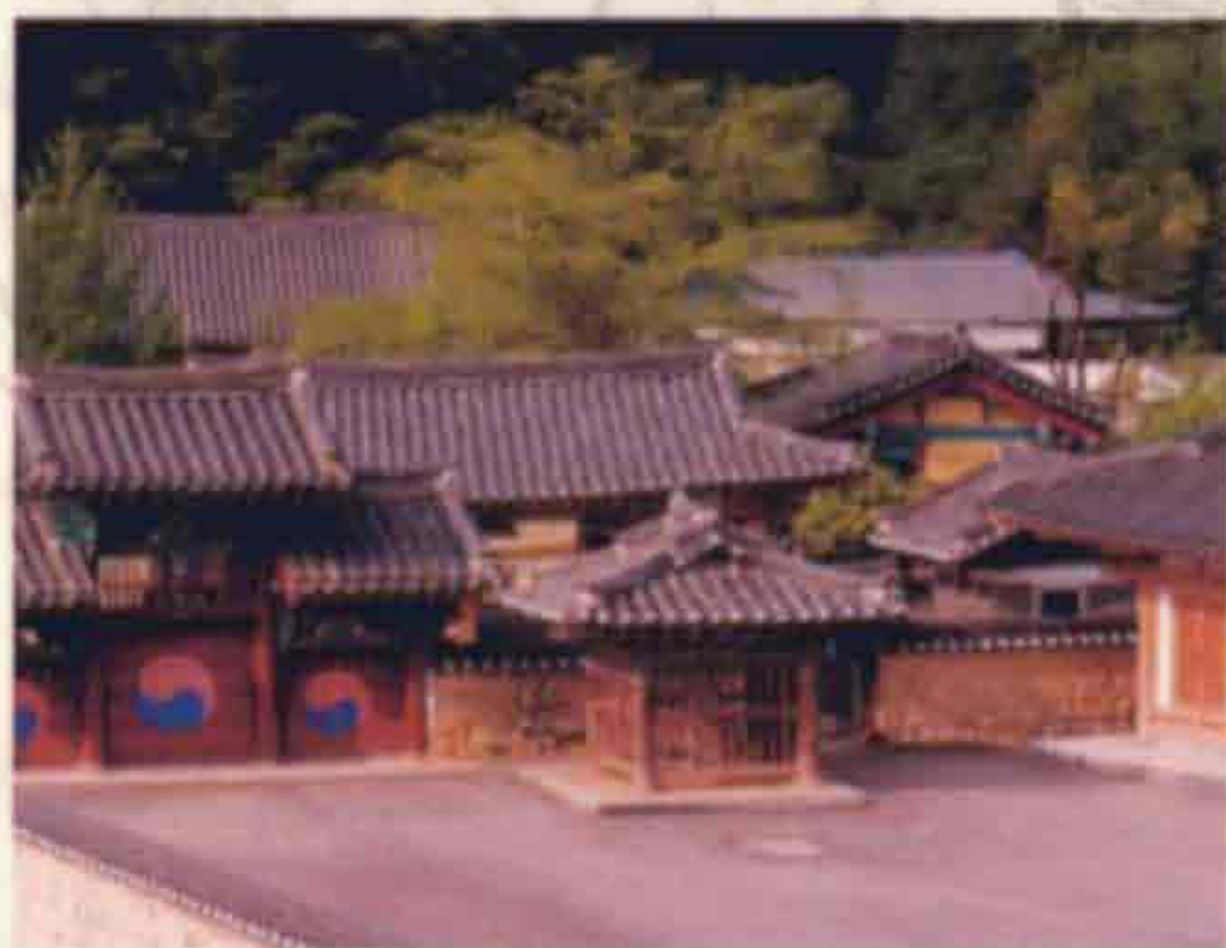
▲ 장수향교(장수읍 장수리)