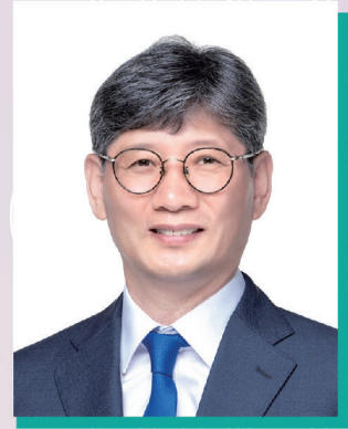
장수군수 최 훈 식